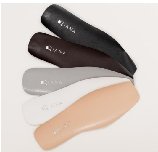
M-合皮箔押し仕様（通常）サンプル

・既製中敷き箔押しネーム仕様（通常）（M-合皮 H-革） サンプルの中から選び頂きます