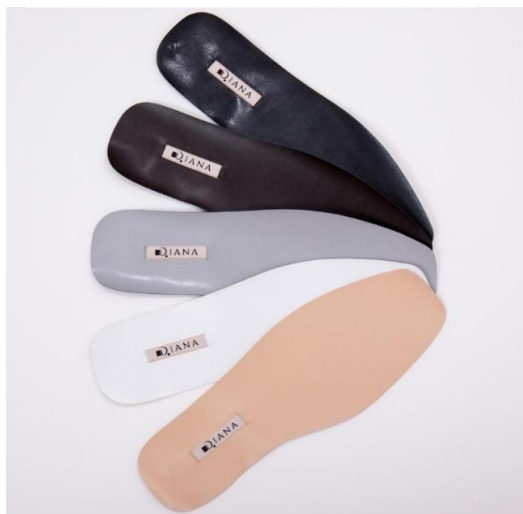
M-合皮織ネーム仕様サンプル