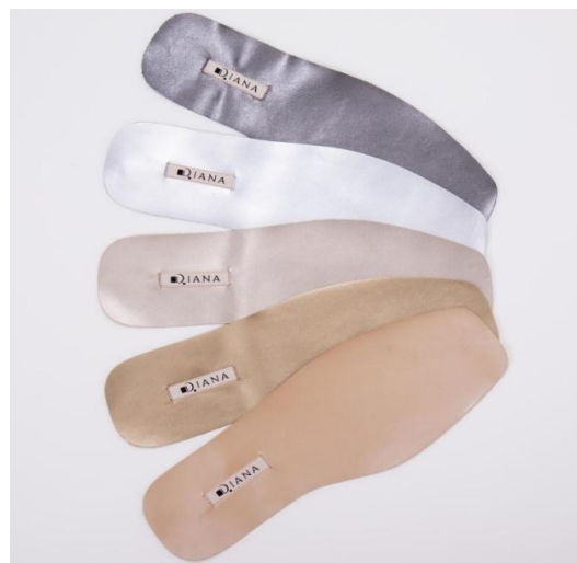
H-革織ネーム仕様サンプル

・既製中敷き箔押しネーム仕様（通常）（M-合皮 H-革） サンプルの中から選び頂きます