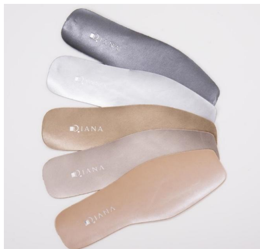
H-革箔押し仕様（通常）サンプル